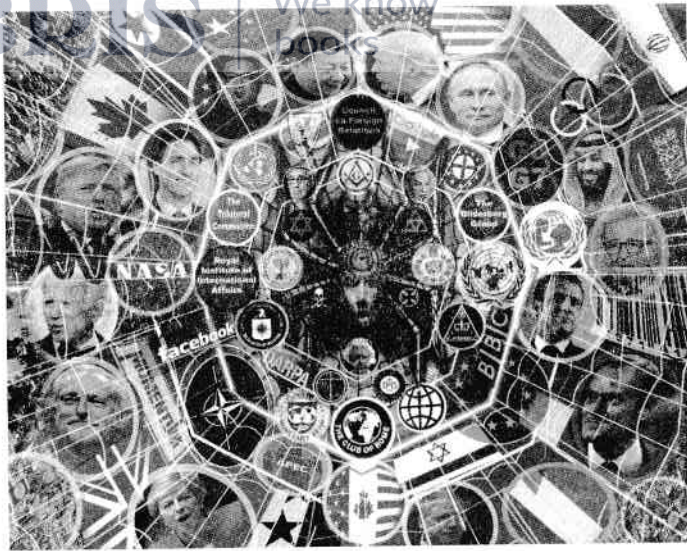
Figura 1: Rețeau globală prin care cei puțini îi controlează pe cei mulți: Consiliul pentru Relații Externe, Grupul Bilderberg, Comisia Trilaterală, Institutul Regal pentru Afaceri Internaționale, CIA, DARPA, NASA, Google, facebook, APEC, BBC, Clubul de la Roma etc.

Ceea ce știe un membru al Lumii numărul 1, niciun membru al Lumii numărul 2 nu trebuie să știe. Cunoașterea pe care s-au străduit atât de mult să le țină secrete cei din Lumea numărul 1 includ (a) planul malefic al înrobirii omenirii prin instaurarea unei dictaturi globale centralizate și (b) natura realității și a vieții însăși. Cea din urmă (b) vizează de fapt ascunderea realității prin promovarea și impunerea a tot felul de teorii care modelează incorect realitatea, ceea ce permite planului ascuns de subjugare a omenirii (a) să prevaleze, așa cum urmează să explic în continuare. Modul în care Oculta Mondială manipulează și interacționează cu populația poate fi comparat cu felul în care un păianjen își prinde prada în pânza sa abil întinsă. „Păianjenul” se află în centru, în umbră, de unde acționează de la distanță și își impune voința prin